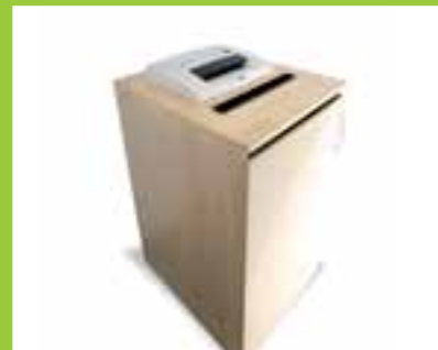
Royal – sekretess