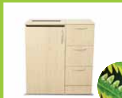
Royal – två moduler