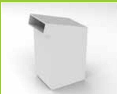
Hungry – en öppning