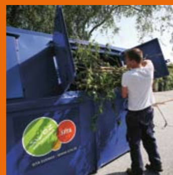
Utrustning för effektiv och funktionell avfallshantering