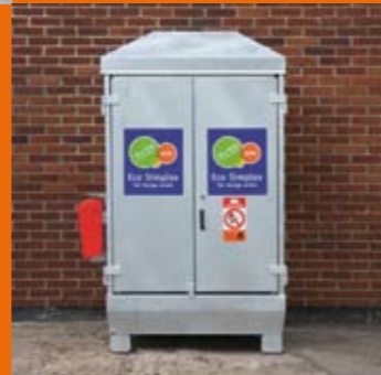
Säker förvaring och hantering av farligt avfall