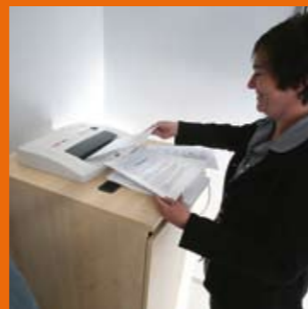
Helhetslösningar med t ex utbildning, statistik och sortering

Kort sagt, att ge dig ett bättre utfall från ditt avfall.