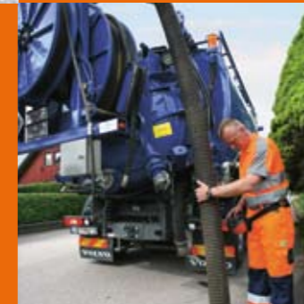
Spoltjänster, torr- och slamsugning