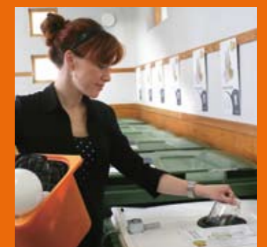
Källsorteringslösningar för alla verksamheter